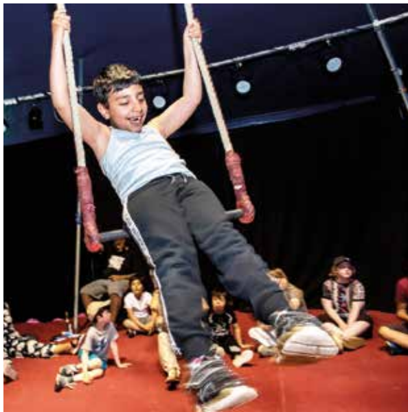
De futurs artistes de cirque?

Durant toute l'année scolaire 2018-2019, les jeudis après-midi, les élèves se sont initiés aux activités du cirque et au monde du spectacle avant de vivre une semaine avec Gommelette et Gabatcho Circus, spécialistes de semaines pédagogiques. Ils se sont entraînés au trapèze, aux pyramides humaines ou encore aux jeux de clowns, avant de produire un spectacle qui a émerveillé familles, amis et connaissances dans une ambiance festive et magique.